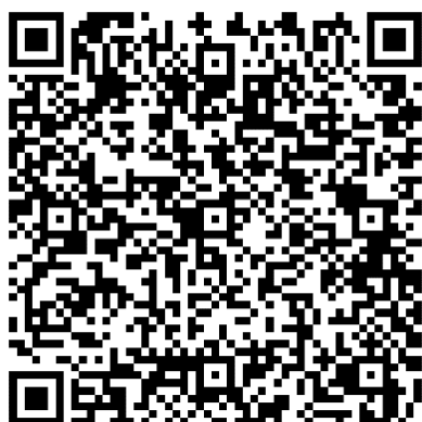
QR kód návod AIS